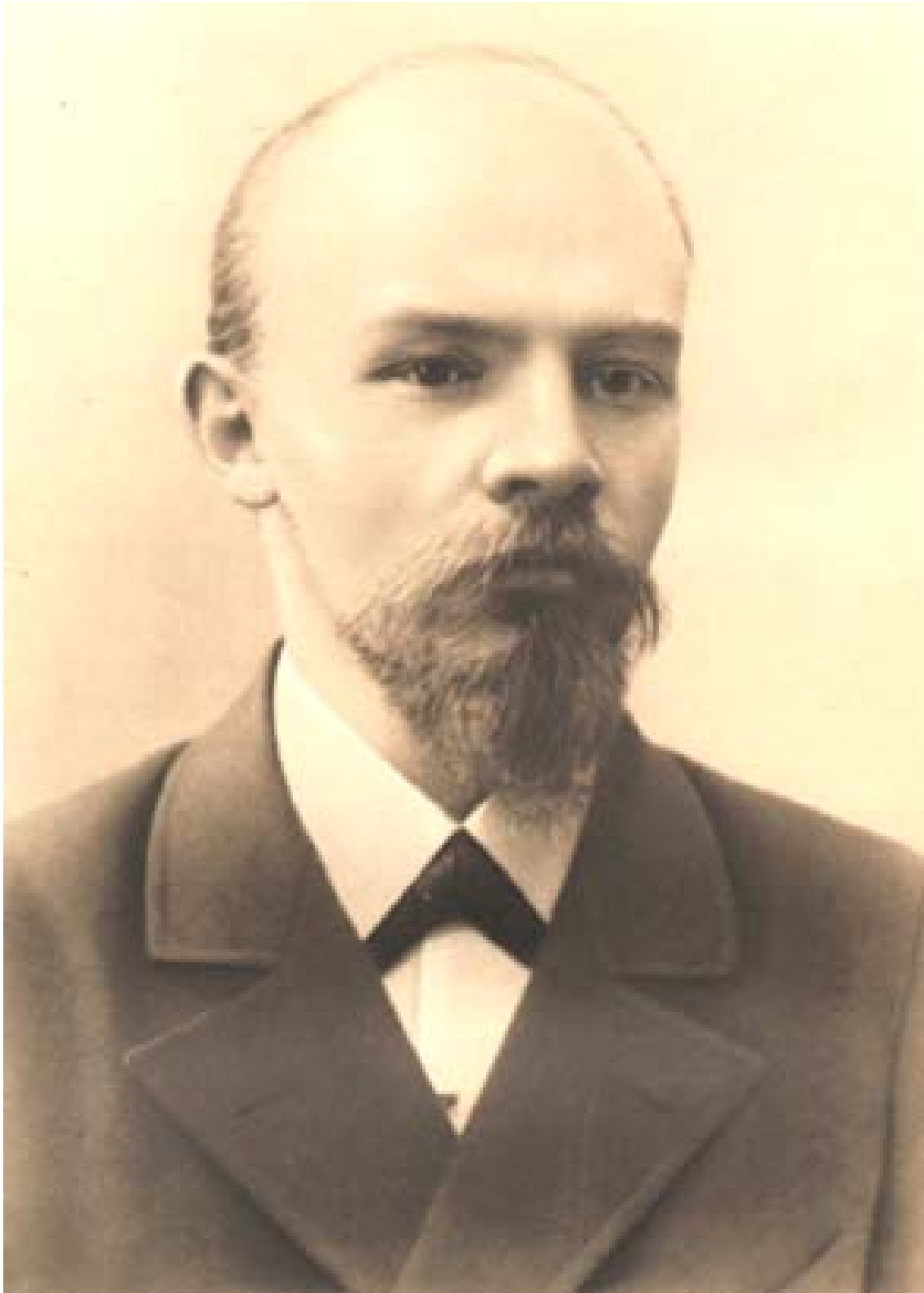
В. И. ЛЕНИН 1897