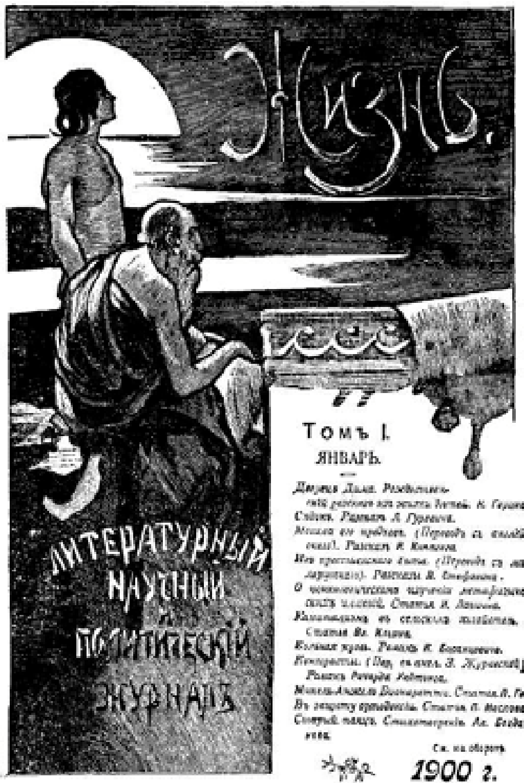
Обложка журнала «Жизнь», в котором была напечатана статья В. И. Ленина «Капитализм в сельском хозяйстве». — 1900 г.