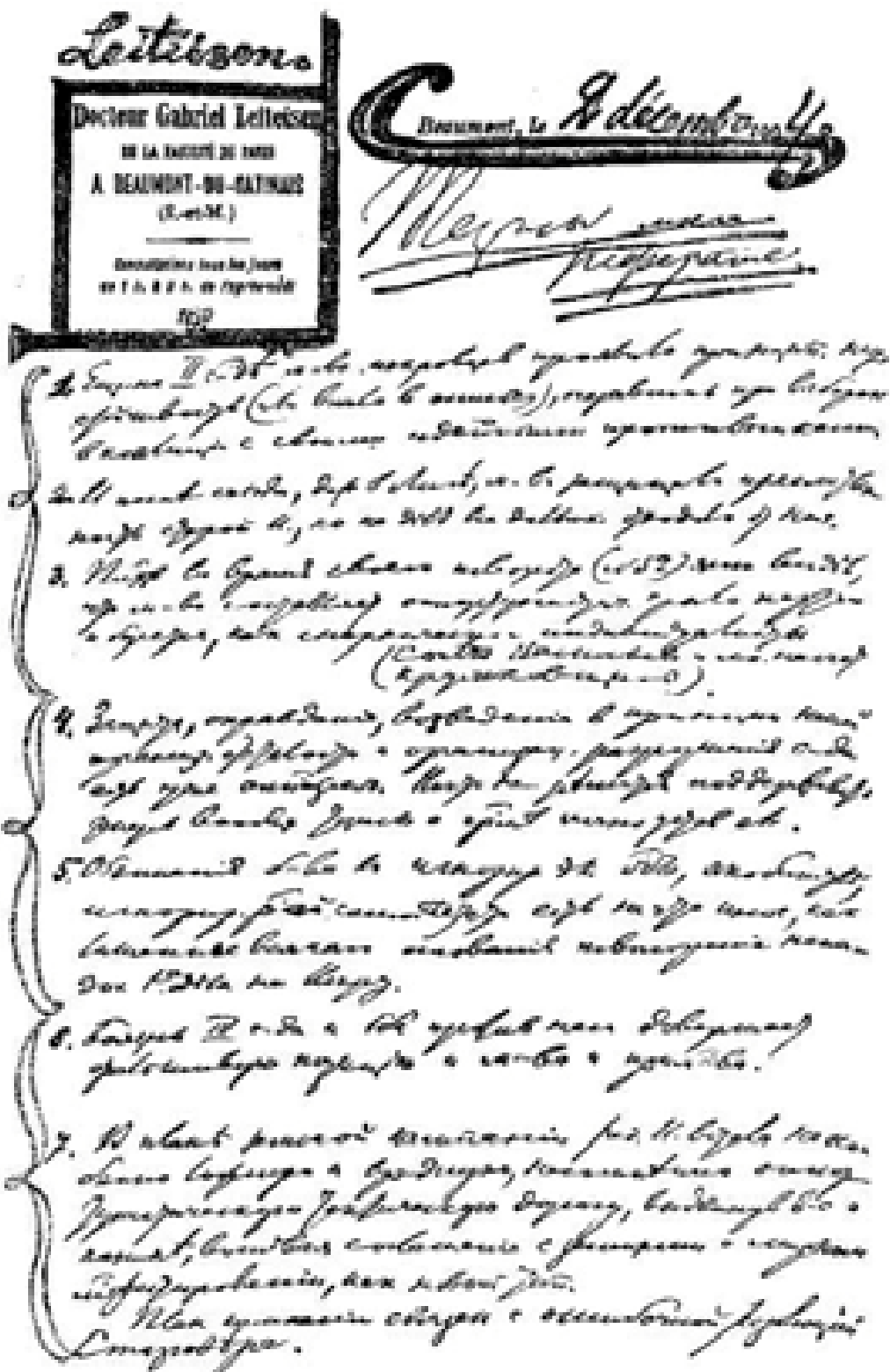
Рукопись В. И. Ленина «Тезисы реферата о внутрипартийном положении». — 1904 г. Уменьшено