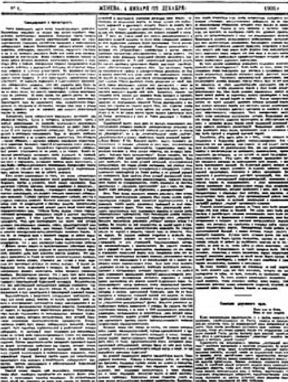
Первая страница большевистской газеты «Вперед» № 1, 4 января 1905 г. (22 декабря 1904 г.) с передовой статьей В. И. Ленина «Самодержавие и пролетариат» Уменьшено