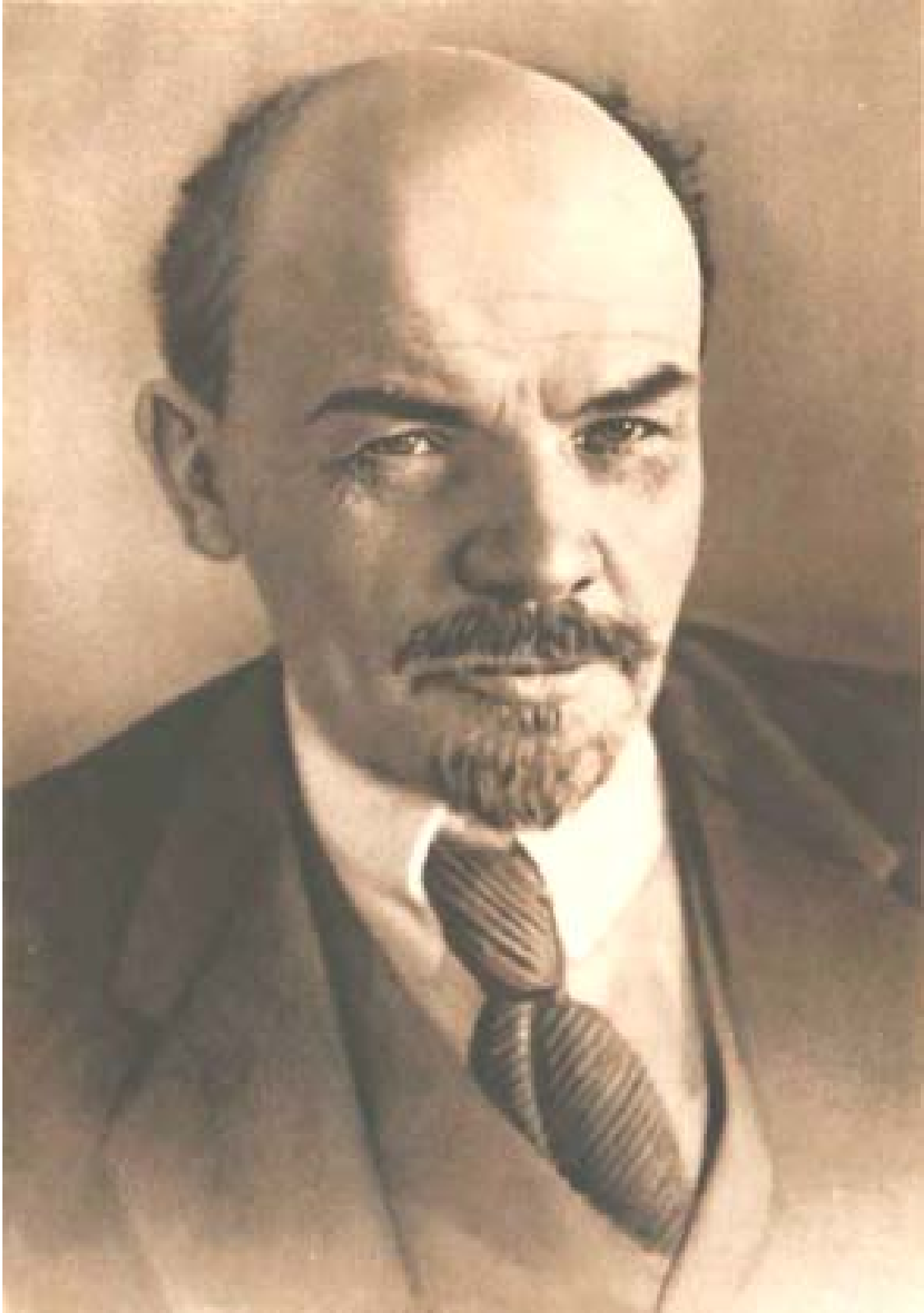
В. И. ЛЕНИН 1918